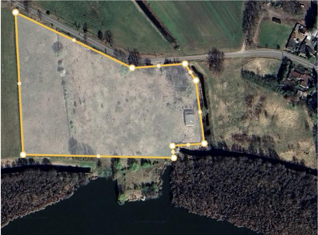
ca. 17.000qm, Umfang ca. 570m