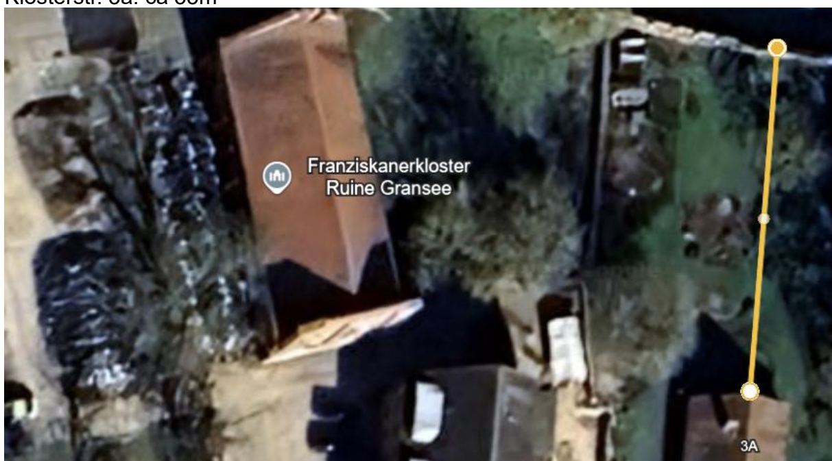
Variante 2 Wendefelder Weg – ca. 24.000qm, Umfang ca. 700m